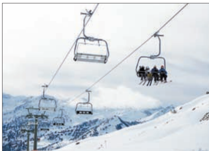
Imatge de les pistes de Baqueira Beret

que tingui un total de 136 dies d'esquí i que per les pistes del complex passin prop de 880.000 esquiadors, segons previsions de l'estació. Baqueira Beret va detallar ahir totes les novetats que presenta per aquesta nova temporada, on destaca la nova pista Eth Coret, amb la qual l'estació arribarà als 167 quilòmetres, l'àmplia renovació en restauració, la millora de la innivació, el forfait amb avantatges BaqueiraPASS i la nova app. Baqueira Beret compartirà doncs aquesta temporada amb una nova pista vermella: