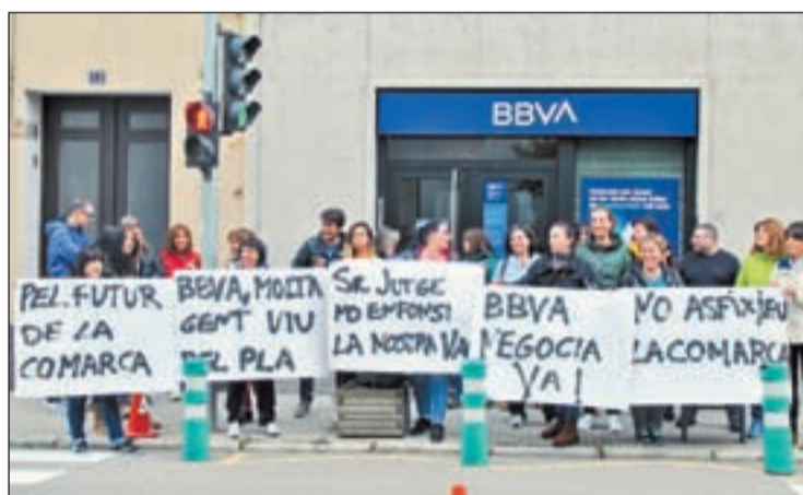
Treballadors es van manifestar ahir al Pont de Suert

Els treballadors, amb el suport dels sindicats, es van concentrar amb pancartes davant les oficines del BBVA a la capital de l'Alta Ribagorça, situada a la travessia urbana de la localitat, per defensar la solució a un problema que amenaça amb deixar al carrer a unes cinquanta famílies i al Pla de l'Ermita amb el 80 per cent d'allotjaments tancats (Ho-