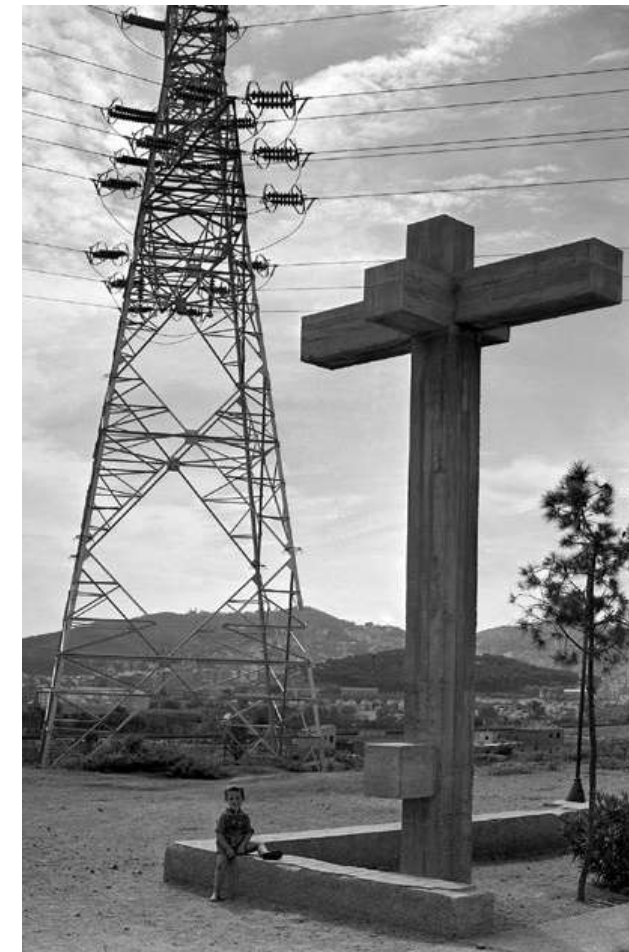
Autor: F. Català-Roca. Parròquia provisional de Sant Sebastià al barri del Verdum. Barcelona, c. 1959. Arquitectes: Oriol Bohigas i Josep Maria Martorell. Autor: F. Català-Roca. Casa Catasús. Sitges, c. 1958. Arquitecte: José Antonio Coderch. Fondo fotogràfic F. Català-Roca