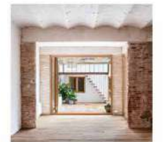
CASA GALERIA RAMON I CAJAL 40, BAIX LLOBREGAT, BARCELONA, ESPAÑA CARLES ENRICH STUDIO