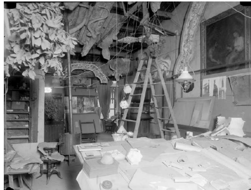
Autor: Ferran. Vista del taller de Gaudí a la Sagrada Família. Barcelona, c. 1926. Col·lecció d'imatges.

Entre d'altres fons, destaquen les tres grans col·leccions d'imatges recollides des de la creació de l'Arxiu Històric i ordenades de forma temàtica, onomàstica i geogràfica respectivament; els fons de fotògrafs de gran rellevància en el nostre país com ara Francesc Català-Roca i Oriol Maspons; la col·lecció de fotografies del Romànic de Lluís Domènech i Montaner; els negatius en placa de vidre de l'obrador de Gaudí; i els positius "vintage" atribuïts a Opisso, del Fons Matamala.