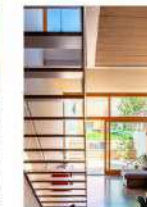
CASA M88 C/ MONTSERRAT, VALLES ORIENTAL, TERRASSA, ESPAÑA RGA ARQUITECTES