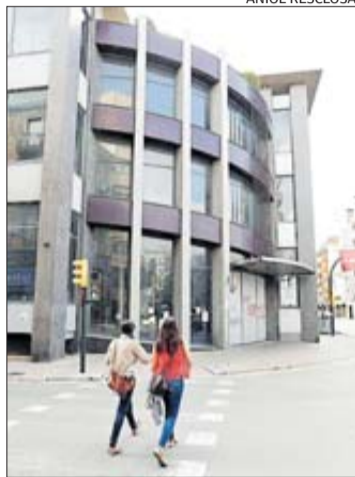
L'edifici, a la carretera Barcelona.