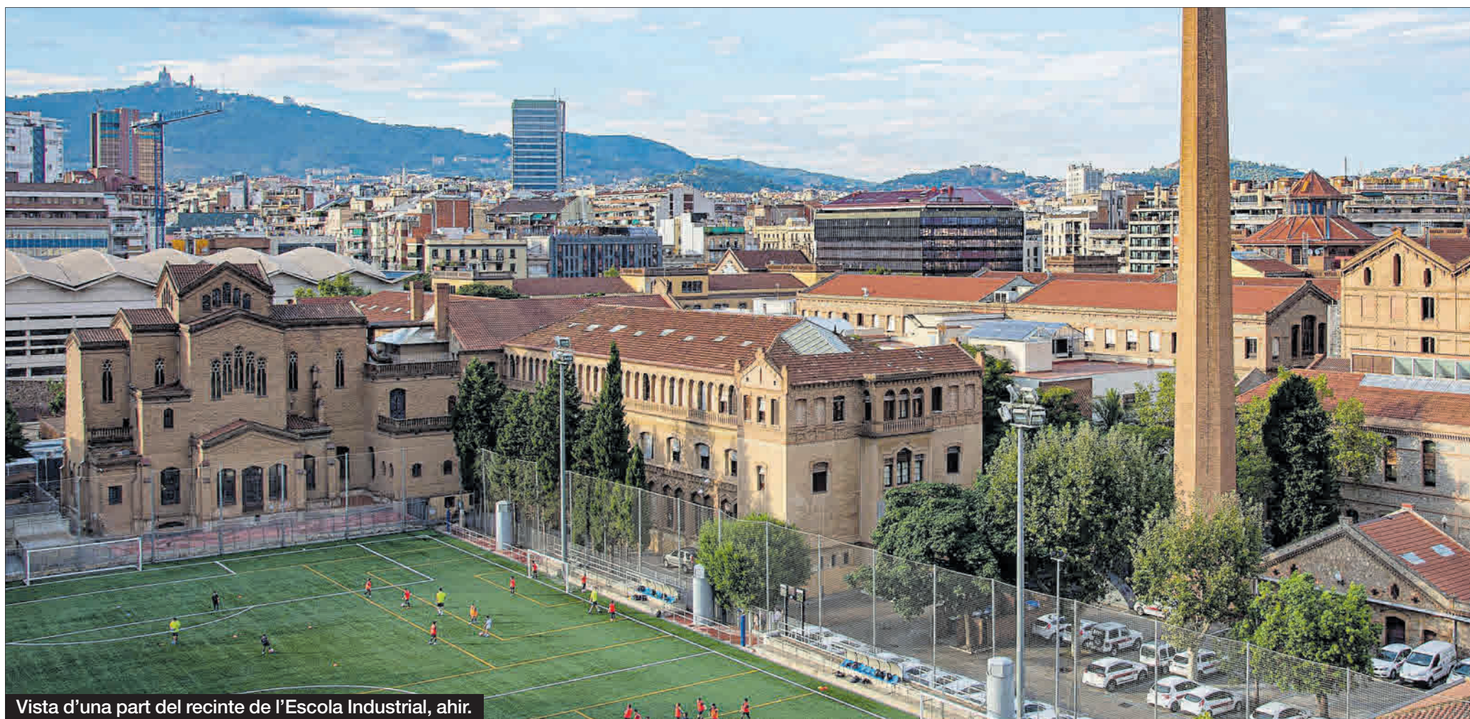
Vista d'una part del recinte de l'Escola Industrial, ahir.

El futur d'un centre sanitari de referència