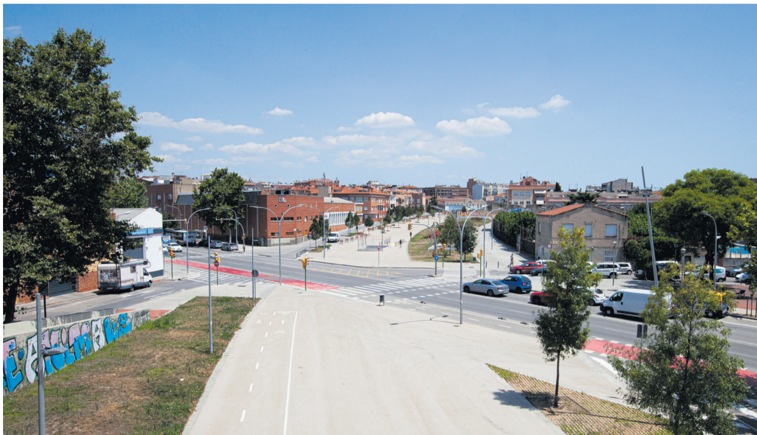
El soterrament la via ferroviària d'FGC a Can Feu ha relligat les dues voreres del barri

Entre els àmbits d'actuació que proposa el Pla destaquen els balcons i l'entorn del riu Ripoll; la Gran Via; i l'N-150 (de l'avinguda de Rafael Casanova fins al carrer de Montserrat).