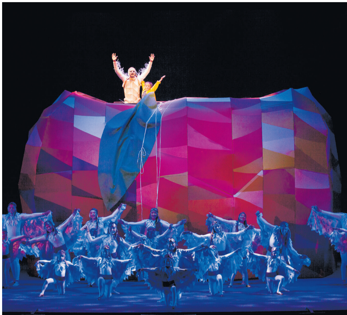
L'estructura del préssec, a l'escenari del Teatre La Faràndula / VICTÒRIA ROVIRA