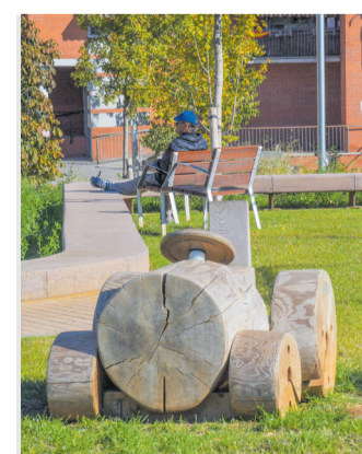
Tant l'arbrat com els elements mobiliaris protagonitzen la plaça / VICTÒRIA ROVIRA