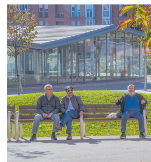
Els bancs creen un espai agradable per parlar

"No només hi vam posar gespa, sinó tot tipus de plantes d'acord amb el cicle anual de llavor i flor, tot permetent que les abelles i les pol·linitzadores trobin flor", explica. Es tracta de configurar un espai en repòs també per als petits animals, que han aconseguit en part gràcies als talussos inclinats. "Green zones de difícil accés que la gent no trepitja", explica l'arquitecta. I, per tant, es pot permetre la floració