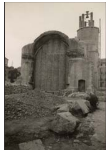
El disseny del nou edifici que proposava Martínez Paricio. (ARXIU HISTÒRIC DEL COAC). L'església al 1939. JOSEP MARIA MARQUÉS.