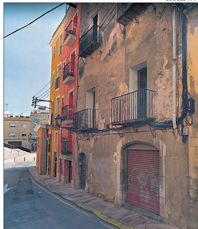
Façana de la Casa de les Ànimes, al carrer Arc de Sant Llorenç.