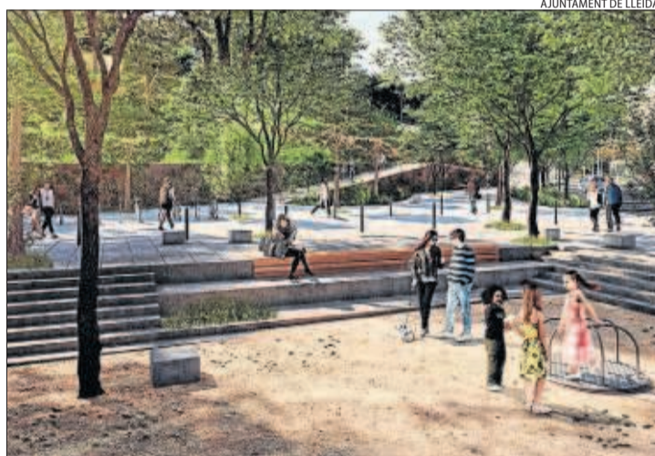
Imatge virtual de la futura plaça Josep Prenafeta, a l'Auditori.

LLEIDA | La reforma de les places de la Panera i Josep Prenafeta, situada davant de l'Auditori Enri Granados, són dos projectes que porten més de dos anys tramitant-se i el ple municipal d'avui, l'últim del mandat, debatrà l'aprovació inicial de tots dos i si surten a licitació o no. La remodelació d'aquests dos enclavaments va ser l'objectiu de la primera edició del concurs públic que va fer la Paeria juntament amb el Col·legi d'Arquitectes anomenat Espais singulars , que data de finals del 2017 i els dissenys definitius del qual es van anunciar el gener del 2018. Des d'aleshores, els projectes han estat en tràmit. En el cas de la plaça de l'Auditori, el projecte preveu suprimir les 52 places d'aparcament per fer una zona arbrada i un nou accés a la Seu Vella. Per compensar la pèrdua d'aparcament, la Paeria preveu 65 noves places d'estaciona-