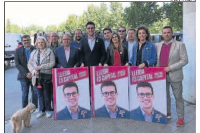
Els membres de la candidatura al Camp d'Esports.