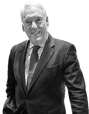
JOSEP POBLET I TOUS President de la Diputació de Tarragona