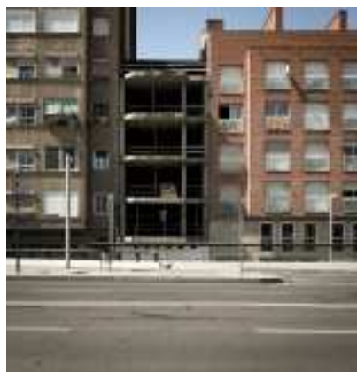
LLEIDA. Petit bloc a mig fer davant de l'estació de trens.