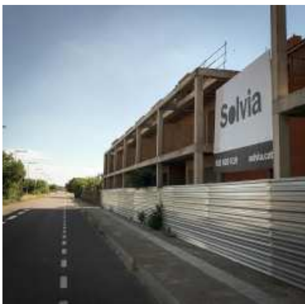
VILANOVA DE LA BARCA. Promoció començada en mans de Solvia.