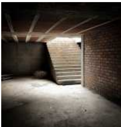
TORREFARRERA. Interior d'una casa adossada que s'ha deixat sense acabar.