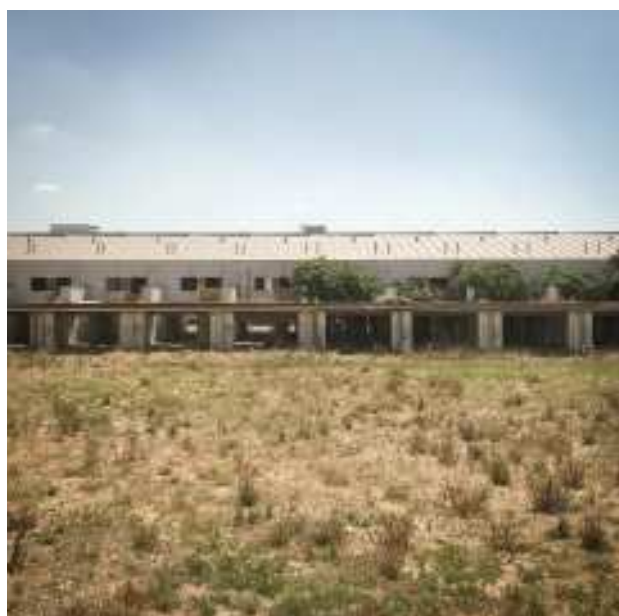
ALCARRÀS. La malesa es menja una promoció sencera.

de la junta del Col·legi d'Arquitectes de Lleida: "Amb un promotor volem recuperar una obra aturada per la crisi a Alcoletge i no és fàcil, l'aplicació de la normativa obliga a fer unes intervencions molt costoses prèvies a la recuperació de la llicència que d'entrada fa inviable tornar-hi. Les obres a mitges són un problema i a