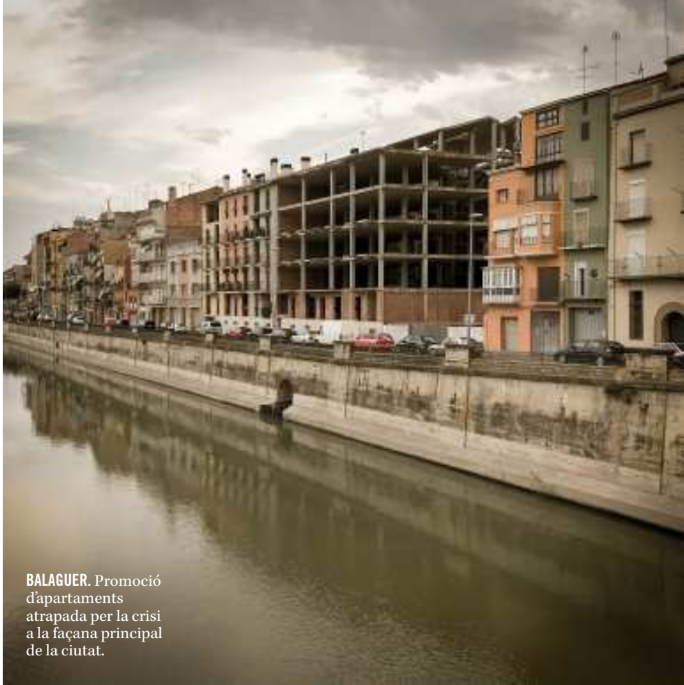
BALAGUER. Promoció d'apartaments atrapada per la crisi a la façana principal de la ciutat.