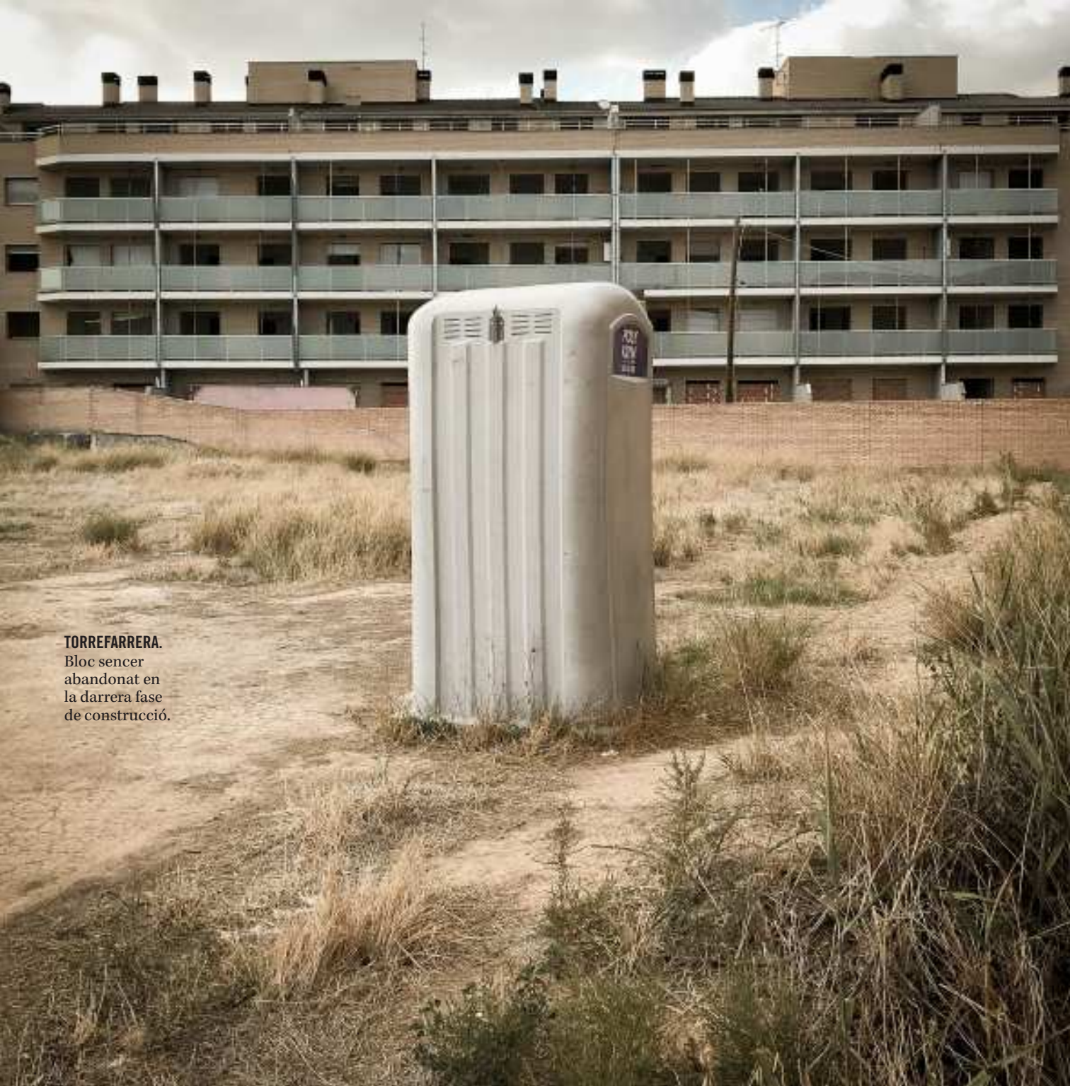
TORREFARRERA. Bloc sencer abandonat en la darrera fase de construcció.

plicitat dels propietaris i una mirada generosa per part de l'administració pel que fa a les normatives, i tan una cosa com l'altra sembla complicat". Helena Guiu, arquitecte lleidatana que actualment treballa a Suècia, tempteja una altra sortida més expeditiva, en sintonia amb el col·lectiu d'arquitectes i urbanistes