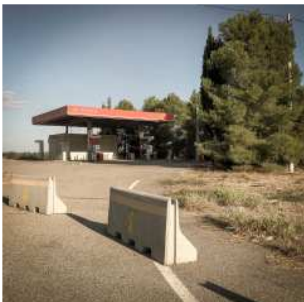
AITONA. Gasolinera abandonada a l'entrada del poble.