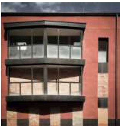
LLEIDA. Promoció tapiada i en procés de degradació al barri de Pardiniyes

La música es va acabar de cop, la ressaca va ser antològica i els efectes devastadors. Acomiadaments, fallides, desnonaments, atur, precarietat, serveis públics al límit del col·lapse, deutes inassumibles i centenars d'obres parades i abandonades que esquitxen el paisatge urbà i recorden, a qui tingui fetge per vo-