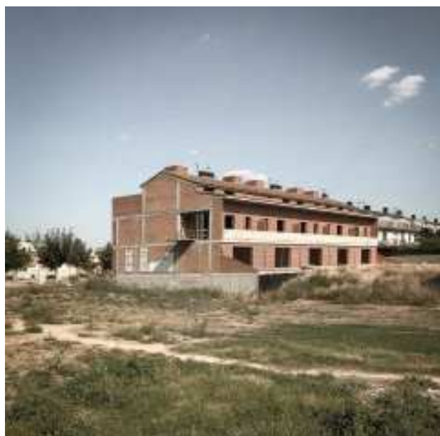
TORREFARRERA. Promoció d'adossades inacabada.