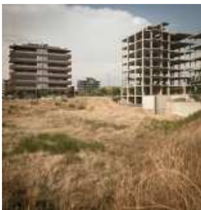
LLEIDA. Estructures de blocs destinades a apartaments d'alt estandard a la Bordeta.