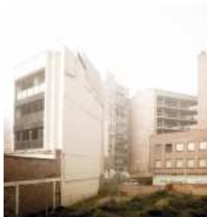
LLEIDA. Dos blocs a mig fer i un solar al barri de Nogueroles.